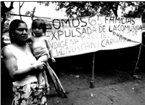
Desplazados di Venustiano Carranza

La colonia sorge nel 1948 da persone provenienti da Aguacatenango. Attualmente vivono qui 900 persone. Nel 1965 incominciano i primi problemi per la terra ed i contadini cominciano ad organizzarsi incontrandosi nella Casa Del Pueblo e nel 1995 occupano 70 ettari della finca La Mesilla sulle cui terre lavorano per 30 anni. Attualmente la terra è coltivata in comune, si divide il raccolto in parti uguali per motivi di sicurezza, perché fino ad ora il governo non ha indennizzato i finqueros che vogliono 8000 pesos per ogni ettaro, questo fa ritenere all'organizzazione che lo stato voglia sgomberarli. Tutti i terreni vicini alla colonia sono occupati da diverse organizzazioni. Gli abitanti della colonia ritengono che le possibili azioni di occupazione di terra debbano essere rivolte alle fincas e non scontrandosi con altri gruppi di contadini. Un elemento di divisione interno alla comunità è rappresentato dalla religione, per la presenza di diversi gruppi religiosi: cattolici, presbiteriani e pentecostali, ognuno col proprio luogo di culto.