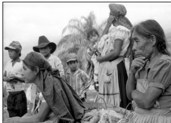
Comunità di San Caralampio