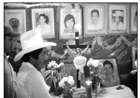
Memorie degli uccisi dalle guardias blancas nel 1996

Di questa comunità fanno parte 56 famiglie di origine indigena tzotzil, sfollate durante il conflitto del 1994. Sono i legittimi proprietari della terra perché sono i discendenti dei contadini che l'acquistarono dalla corona spagnola. È sorta il 28 giugno 2002, quando sono stati recuperati parte dei 1600 ettari che formavano la finca ; attualmente la comunità si estende su 210 ettari, ed ogni famiglia coltiva 3 ettari di terra per il proprio sostentamento. L'organizzazione è a livello comunitario e si propone come obiettivo di recuperare altri 115 ettari, per arrivare ad avere 5 ettari per famiglia, condizione presunta indispensabile per il sostentamento della comunità. La situazione attuale costringe un buon numero di famiglie a vivere e lavorare in città per molti mesi l'anno. Nella comunità si sono formati alcuni gruppi di lavoro collettivo come allevatori ed apicoltori, oltre allo sviluppo di attività collettive per la comunità che vanno dalla costruzione di spazi municipali, alla pulizia delle strade. C'è una scuola che non sta funzionando per mancanza di bambini ed i pochi che ci sono vanno a Laguna Verde; il servizio sanitario più vicino è un ospedale da campo che si trova sulla strada per Venustiano Carranza.