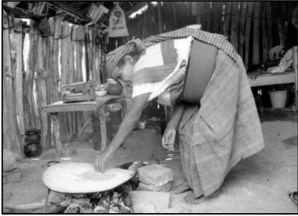
Comunità di San Caralampio